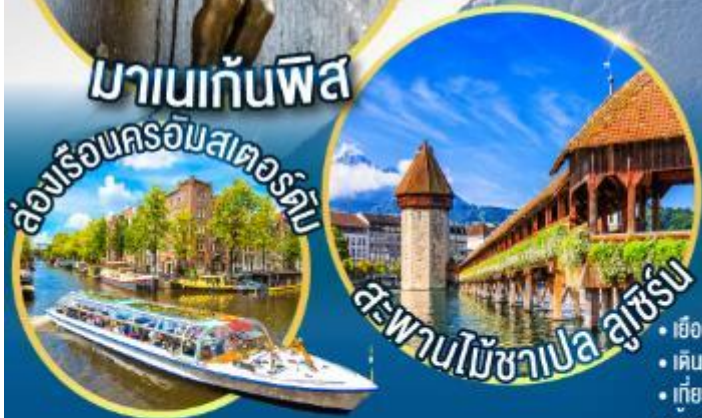
ล่องเรือชมเมืองแห่งสายน้ำ นครอัมสเตอร์ดัม