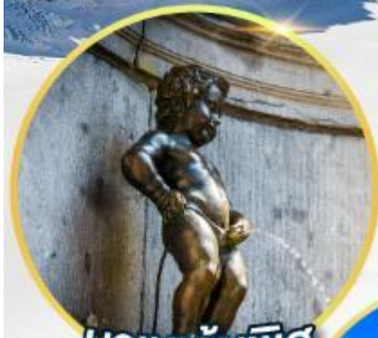
มานนกันพิส