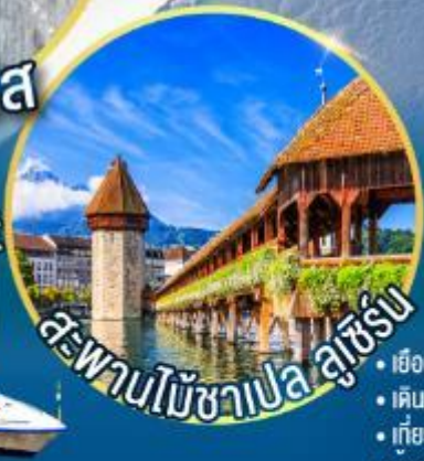
สะพานไม้ชาเปล ลูเซิร์น