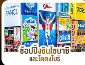
ช้อปปิ้งชินไซบาชิ และโดตงโมริ