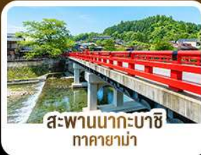
สะพานนากะบาชิ ทาคายาม่า