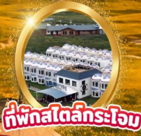
ที่พักสไตล์กระโจม