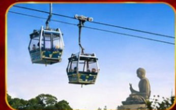
กระเช้านองปิง