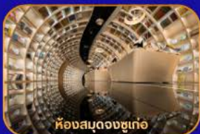
ห้างสรรพสินค้า