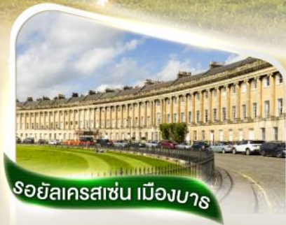
รอยัลคราซัน เมืองบาร