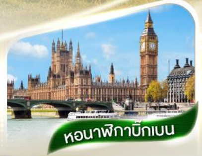
หอนาฬิกาบิกเบน