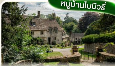
หมู่บ้านไบบิวรี่