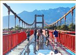
สะพานแก้วลี้เจียง