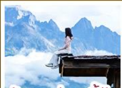
ร้านอาหารภูเขาต้นอัน

ชมวิวภูเขาหิมะสวยสุดโรแมนติกกับแสงยามพลบค่ำ เที่ยวเมืองโบราณต้าหลี่ ลี้เจียง ป่าชา แซงกรี่ล่า ชมวิถีชีวิตของชนชนยูนนานและทิเบต พิสูจน์ความกล้าท้าเดินชมสะพานแก้วลี้เจียง • ซุปโป่งเพลินที่ถนนคนเดินหนานผิงเจียง