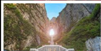
เขาประตูลั่วจื่อ