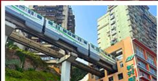
รถไฟทะลุคด