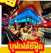
บูฟเฟต์ซีฟู้ด