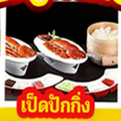
เปิดปิ้งกั๊ง