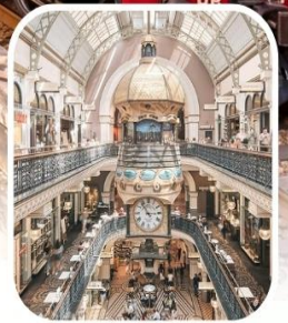
QUEEN VICTORIA BUILDING