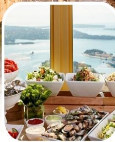
SKYFEAST BUFFET SYDNEY TOWER