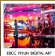
EDCC YIYUN DIGITAL ART