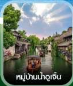
หมู่บ้านน้ำอู๋เจิน