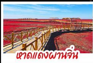
หาดแดงผานจีน