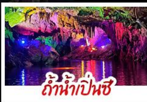
ถ้ำน้ำเป็นสี