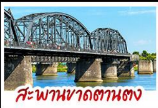
สะพานหวาดถานตง

2 มหัศจรรย์ธรรมชาติระดับโลก "หาดแดงผานจีน" คู่กับ "ถ้ำน้ำเป็นสี" ยืนมองฝั่งเกาหลีเหนือที่ตามอง • ชมความยิ่งใหญ่ของพระราชวังเส้นหยางกู่กั๋ง