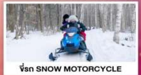
ขี่รถ SNOW MOTORCYCLE