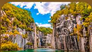
เขาดงเคียว-เมืองโพซอน