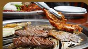
เมนูย่างสไตลเกาหลี