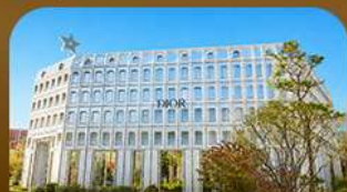
ชานซองซู