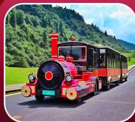
"อุทยานเขานางฟ้า"