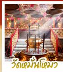
วัดเมื่อนไทมว