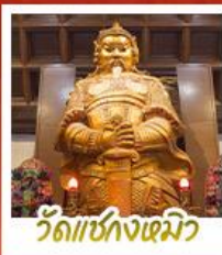
วัดเซกุงเมิว