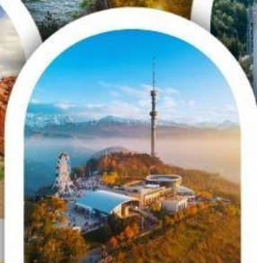
จุดชมวิวเขาค็อกโกเบ