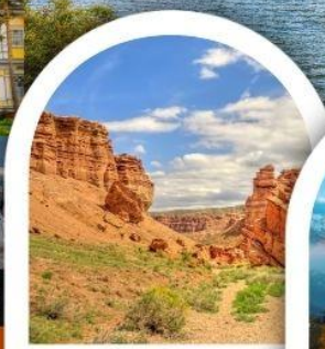
ซารินแคนยอน