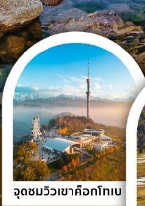
จุดชมวิวเขาค็อกโทเบ