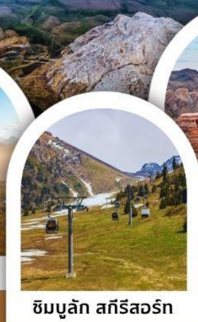
ซิมบูลัก สกีรีสอร์ท