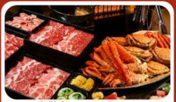
บุฟเฟ่ต์ซาบู ซาบู 3 ชนิด