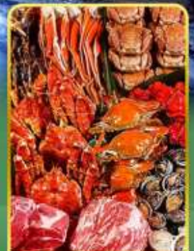
ปิ้งย่างพรีเมียมมันตะ