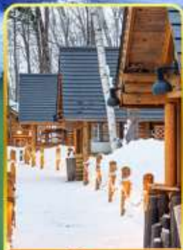
มิตซูโกชิ