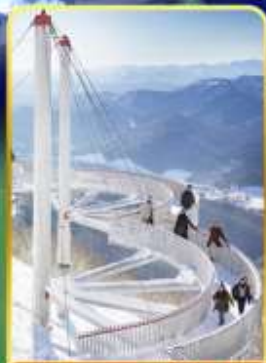
ระเบียงหมอกน้ำแข็ง