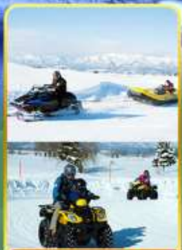
BIBAI SNOW LAND