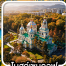
โบสถ์เซนคอฟ

นั่งกระเช้าคอนโดล่าขึ้นสู่ชิมบูลัก สตรีสออร์ก ไร่มุกแห่งเทือกเขาเทียนชาน ทะเลสาบโคลโซ หุบเขาเจดี โอกูซ / ภูเขาหินเทพนิยาย / ทะเลสาบอัสซิกกุล ชมการแสดงการล่าเหยื่อของนกอินทรี