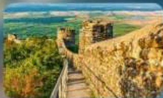
กำแพงเมืองโบราณซิกนากี