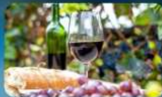
พิเศษ!! ซิมไวน์ท้องถิ่น