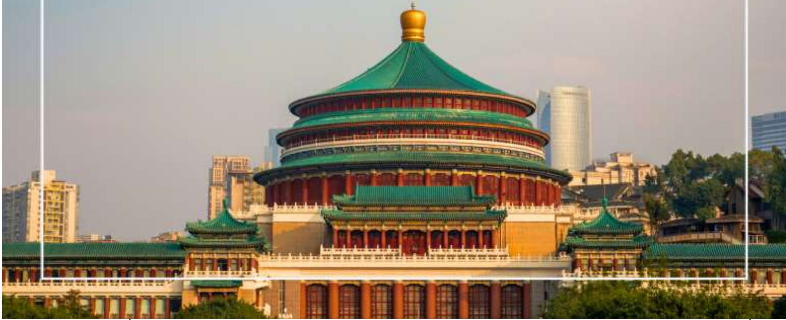
มหาศาลาประชาชนแห่งเมืองฉงชิ่ง (Chongqing People's Grand Hall)

จากนั้นนำท่าน นั่งรถไฟทะเลลู่ตีก เป็นหนึ่งในประสบการณ์ที่น่าสนใจและเป็นเอกลักษณ์ในเมืองฉงชิ่ง รถไฟเส้นนี้มีเส้นทางที่ผ่านอาคารและที่อยู่อาศัย ทำให้ผู้โดยสารรู้สึกเหมือนกำลังนั่งรถไฟที่ทะลุผ่านตึกสูง เส้นทางที่น่าสนใจในรถไฟนี้รวมถึงสถานีที่มีชื่อเสียง เช่น สถานีหลี่จื่อป่า (Liziba Station) ซึ่งตั้งอยู่ในพื้นที่ที่มีความหนาแน่นของประชากร การนั่งรถไฟทะเลลู่ตีกนี้เป็นวิธีที่ยอดเยี่ยมในการสัมผัสกับวัฒนธรรมเมืองฉงชิ่งและชื่นชมกับการพัฒนาเมืองที่น่าทึ่ง