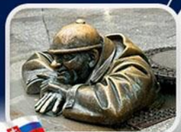
ประติมากรรม Cumil

มาเรียนพลาซซ์ • บ้านเกิดโมสาร์ท • พระราชวังฮอฟบวร์ก • ซาลส์บวร์ก • บ้านเกิดโมสาร์ท • เกรโกเดร์สตรีก • ทะเลสาบคอนิกซ์ • หมู่บ้านอัลล์สตัดท์ • อนุสาวรีย์มาเรียเทเรซา