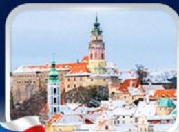
เมืองเช็ก คุลมอฟ