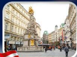
ซ็อบบิงการ์ทเนอร์สตรีท