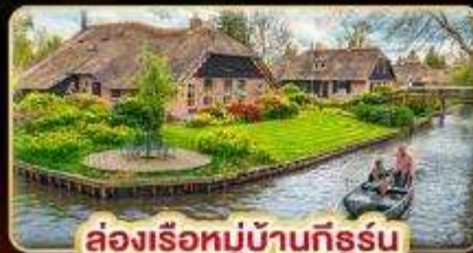
ล่องเรือหมู่บ้านกังหัน