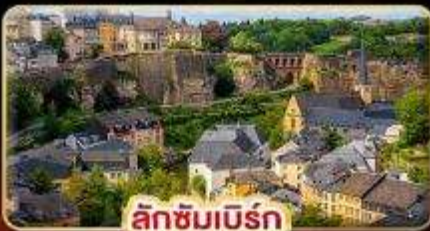
ลักซิมเบิร์ก