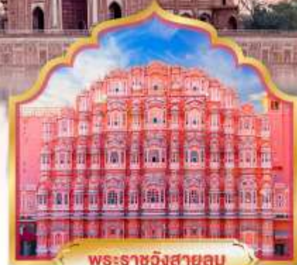
พระราชวังสายลม