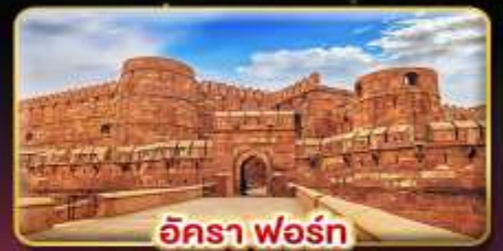
อัครา ฟอรั