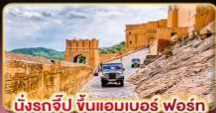
เมืองจิป ขันแอมเบอร์ ฟอรั